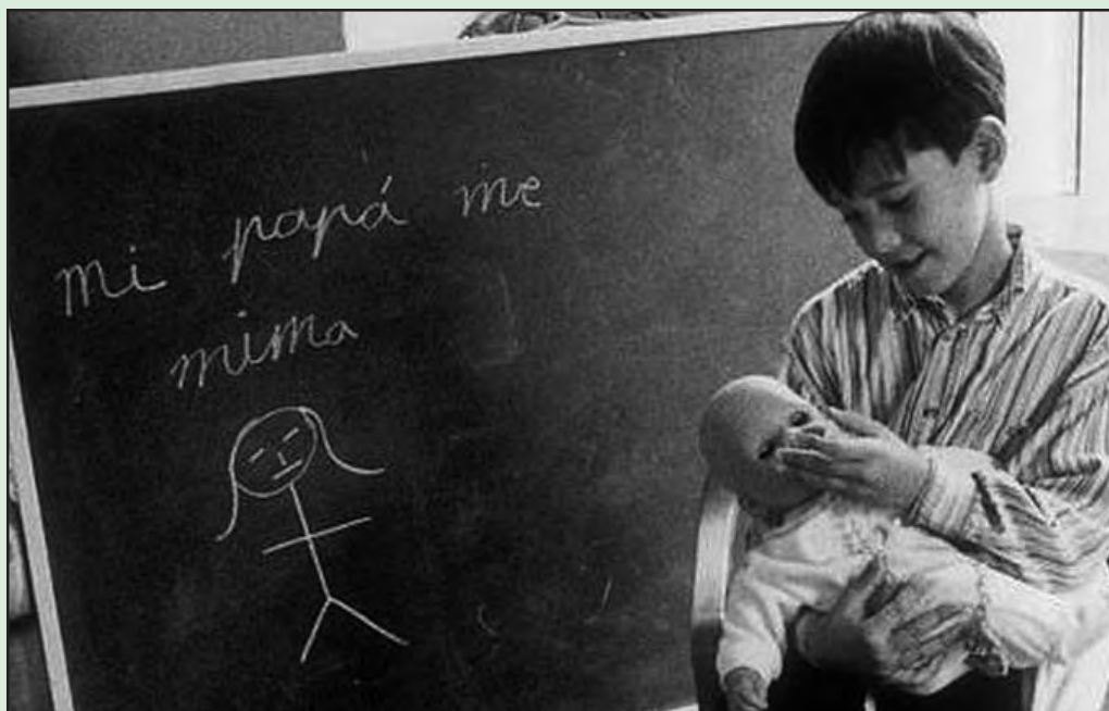
Fotografía: del concurso "Hombres en proceso de cambio", del Ayuntamiento de Jerez.