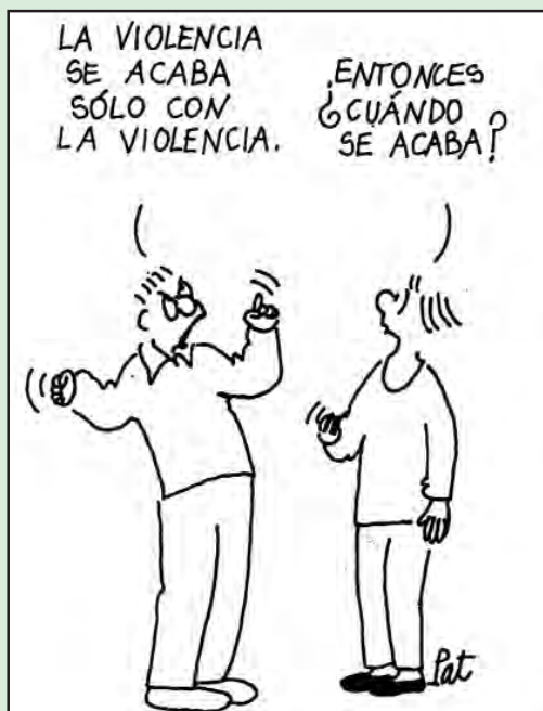
Ilustración: Pat Carra (2001): Bombas de risa, Horas y Horas, Madrid.